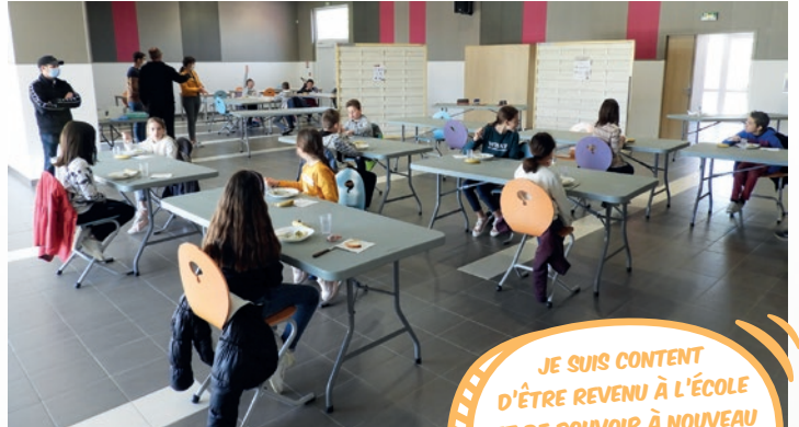
Les salles de restauration réaménagées pour respecter la distance exigée entre chaque enfant.

JE SUIS CONTENT D'ÊTRE REVENU À L'ÉCOLE ET DE POUVOIR À NOUVEAU MANGER À LA CANTINE. J'AVAIS TRÈS ENVIE DE REVOIR LES COPAINS