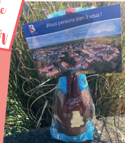
Un œuf au chocolat pour Pâques pour les seniors de la commune.