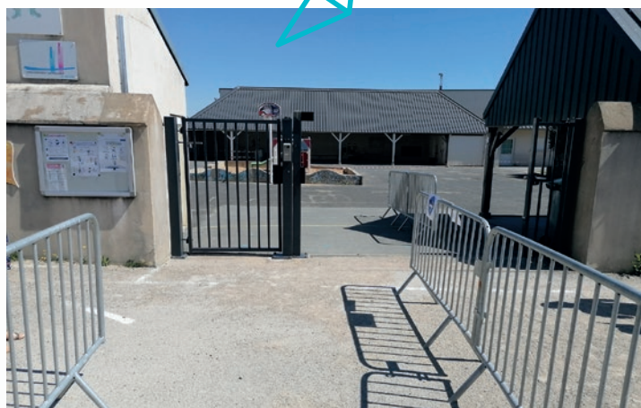
L'entrée de l'école avec les différents couloirs d'accueil.

Nous recherchons des bénévoles, alors si vous souhaitez intégrer la formidable équipe de l'OGEC, vous pouvez contacter pour de plus amples renseignements : Fabien : 06 27 08 45 31 ou Marie : 06 99 08 91 22