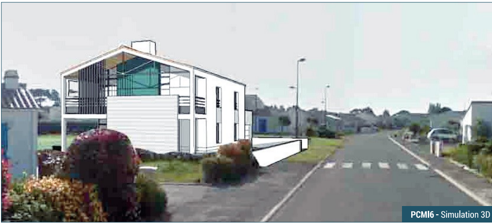
PCMI6 - Simulation 3D