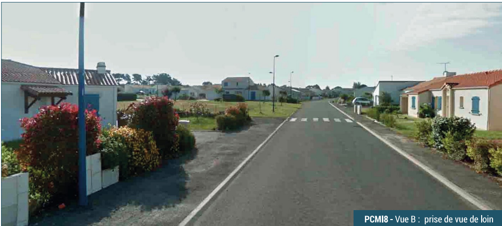
PCMI8 - Vue B : prise de vue de loin