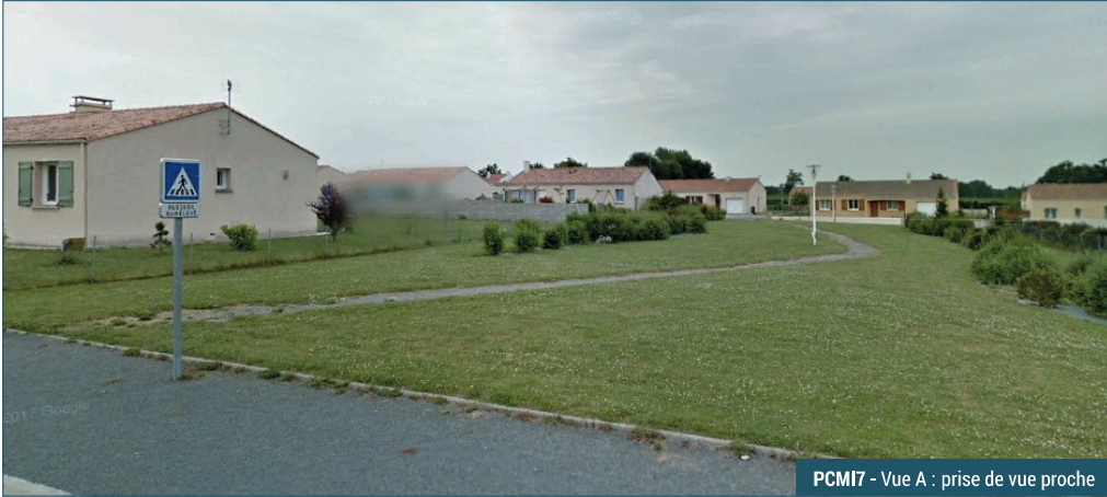
PCMI7 - Vue A : prise de vue proche