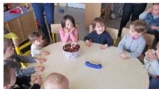
• Nous avons aussi fêté les anniversaires des enfants et des tatates par mois de naissance.

Lors de ces moments de partage, les enfants rient ou pleurent lorsque le copain ne veut pas prêter un jeu... Mais tous ces petits moments sont importants pour leur socialisation, la découverte, l'estime de soi... Les échanges sont aussi très riches pour les assistantes maternelles.