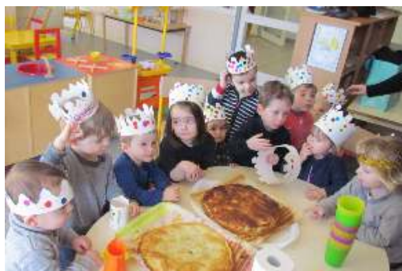
• Confection d'un sapin de Noël au Nutella, galette des rois, crêpes, gaufres...