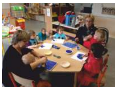
• Peintures et bricolages pour Noël, le carnaval, Pâques.