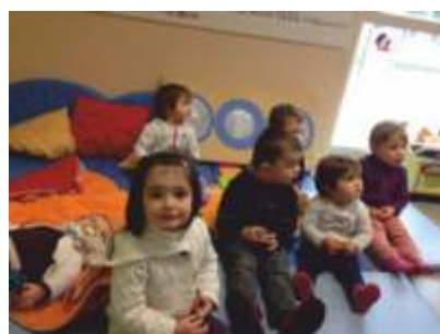
• Lecture, chants, jeux libres...