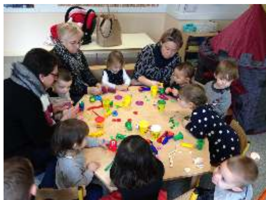
• Activités jeux de tables : pâte à modeler, dessins, jeux de motricité fine.

Plusieurs activités ont été réalisées lors des matinées d'éveil les mardis et vendredis matin à la périscolaire.